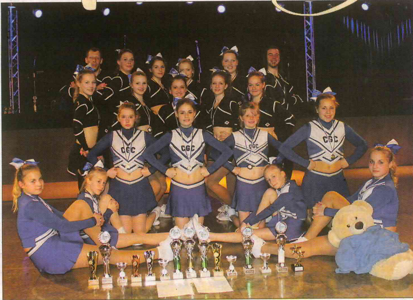
Die „Candy Girls“ zeigen stolz ihre hart erkämpften 18 Pokale nach der großen Meisterschaft auf Juist.

+++ ERSTES BABY UNTERWEGS Nazan Eckes und ihr Mann Julian Khol erwarten ihr erstes Kind. Die „DSDS“-Moderatorin bestätigte jetzt, dass sie bereits im fünften Monat ist +++ SCHON WIEDER GETRENNT? Til Schweiger und seine Freundin Anne Wilk sollen nach Informationen der „Gala“ kein Paar mehr sein +++ SECHS MONATE OHNE FÜHRERSCHHEIN Weil er 18 Punkte in seiner Verkehrssünderdatei in Flensburg hat, muss Jogi Löw den Führerschein für sechs Monate abgeben +++ ZURÜCK AUF DER BÜHNE Zwei Monate nach dem Tod seiner Lebensgefährtin L'Wren Scott hat Mick Jagger die Tour mit den „Rolling Stones“ fortgesetzt. Er zeigte sich außerdem gut gelaunt bei Twitter +++ HOCHZEIT VERSCHOBEN Sängerin Perrie Edwards weiß nicht, wann sie ihren Verlobten, „One Direction“-Star Zayn Malik, heiraten soll - beide arbeiten zu viel +++ NEUE TURTELTAUBEN Filmschönheit Cameron Diaz und Rockstar Benji Madden sollen ein Paar sein. Verknüpelt haben soll sie Nicole Richie, die mit Benjis Zwillingbruder Joel verheiratet ist +++ TWITTER-GRUB AUS DEM GEFÄNGNIS Rapper Wiz Khalifa machte einem Polizisten weis, dass er seine Frau anrufen müsse - stattdessen knipste er ein Selfie für Twitter +++ EHREN-DOKTOR-TITEL FÜR KOMIKER Hollywoodstar Jim Carrey darf sich jetzt Doktor nennen: Die Maharishi University of Management in Iowa verlieh ihm einen Ehrendokortitel +++