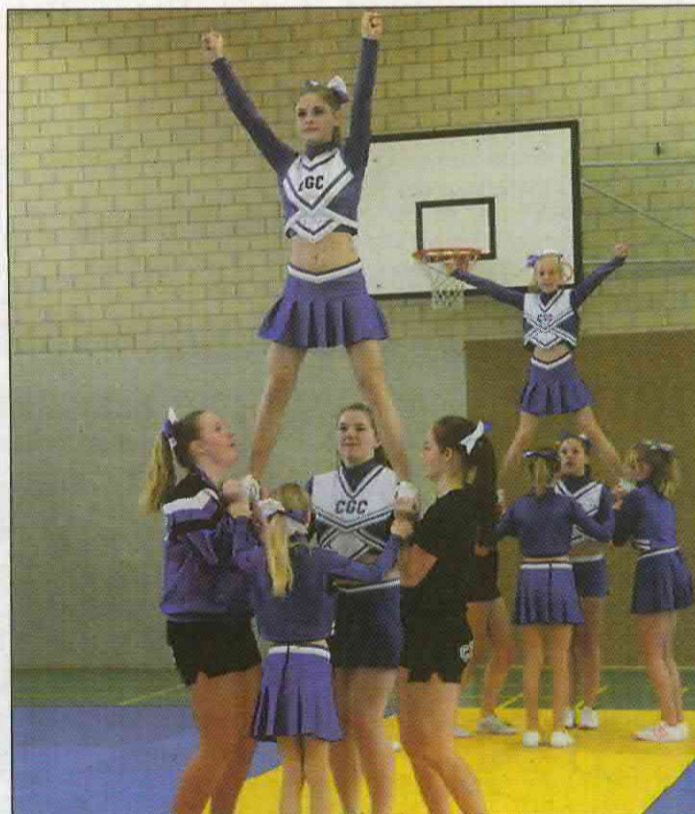
Schwindelerregende und faszinierende Akrobatik bei den Generalproben zur Meisterschaft.

Das Senior-Team besteht aktuell aus zehn Mädchen und zwei Jungen, sucht aber gerne Verstärkung ab 16 Jahren. Interessierte können freitags (außer in den Ferien) ab 18.45 Uhr in der Turnhalle der Eichenwall-schule, Dorfstraße, Leer beim Training zuschauen oder mitmachen und selbst die Freude des Cheerleadings erleben.